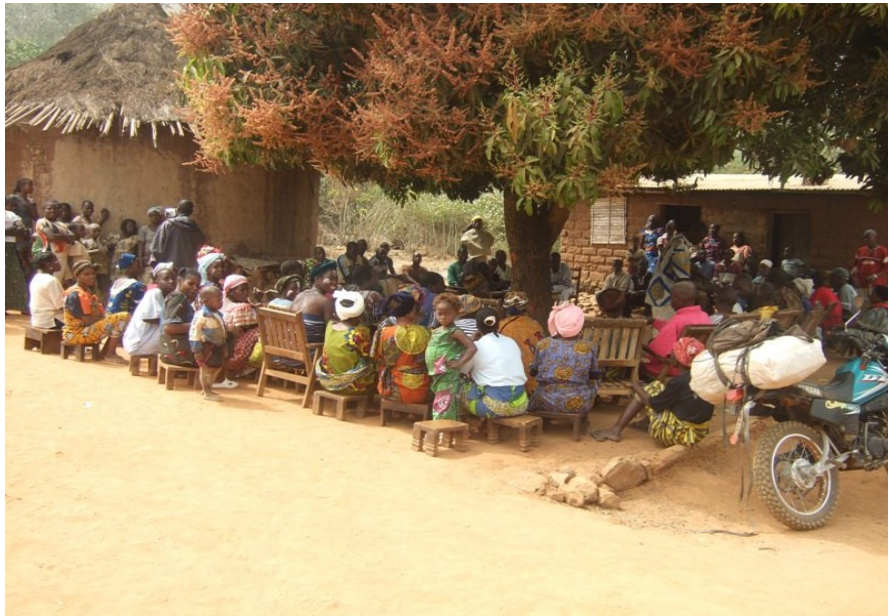
Une assemblée du Konon , population de Ditomba (Biankouma)

traditionnelle répondant à l'idéal démocratique ou un élément de la tradition orale qui pourrait être mis au service du développement ? Donner une réponse à cette question sera sans doute une des ambitions de notre thèse. Ce qui est certain c'est que cette réponse devra tenir compte du fait que dans sa forme actuelle le konon , tout en donnant le droit à l'expression à tous les participants mâles, ne remet pas en question le pouvoir de décision exclusif des anciens. Par ailleurs, la participation des femmes est laissée à la discrétion du porte-parole.